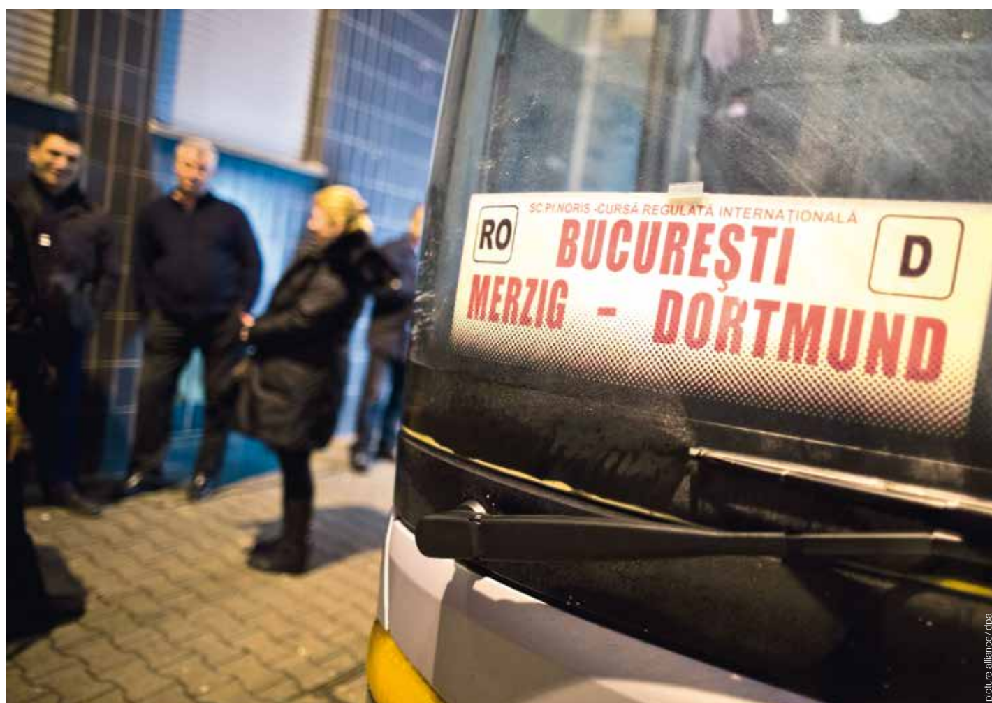
Arbeitnehmer aus Bulgarien und Rumänien dürfen sich seit Januar überall in der EU niederlassen. / Workers from Bulgaria and Romania may settle wherever they like in the EU starting January.