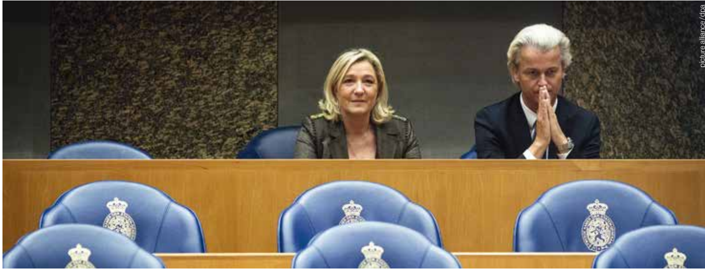
● Front-National-Chefin Le Pen und der niederländische Rechtspopulist Wilders haben sich für die Europawahl zusammengetan. / The leader of the Front National Le Pen and Dutch right-wing populist Wilders have joined forces for the European elections.