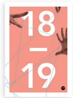
Softcover „Koralle“ Bestell-Nr. 2550B