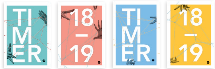
„Türkis“ – 2550