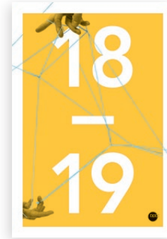
Hardcover „Gelb“ Bestell-Nr. 2549