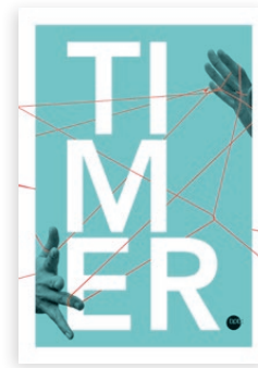
Softcover „Türkis“ Bestell-Nr. 2550

Auch in diesem Jahr: bpb-Timer-Inhalt als Datei bestellen und schuleigenen Timer selber drucken. Anfragen an timer@bpb.de