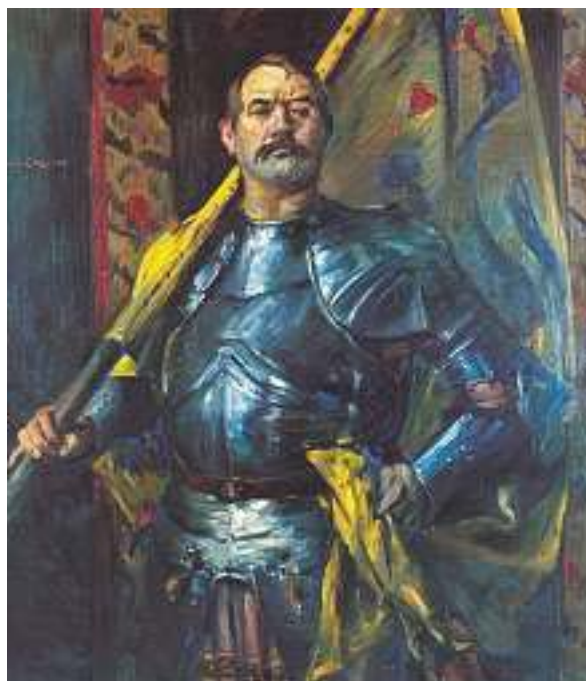
In Lovis Corinths Gemälde Selbstporträt als Fahnenträger (1911) spiegelt sich die Faszination des Künstlers für Rüstungen.

Zur gleichen Zeit brachte der Bismarck-Kult viele Bilder hervor, auf denen Rüstungen zu sehen sind. In Bismarck-Apotheose (1890) von Ludwig Rudow erscheint der große Mann mit Germania an seiner Seite, 23 und auf dem hoch aufragenden Hamburger Bismarck-Denkmal trägt er die Rüstung der Kreuzritter. 24 Lovis Corinth, ein konservativer Künstler, der sich durchaus an seiner eigenen Ähnlichkeit mit Bismarck erfreute, zeigte sich besonders fasziniert von bewaffneten männlichen Rittern. Sein Selbstporträt als Fahnenträger (1911) ist eine überhebliche Selbstinszenierung, aber Corinth verarbeitete den Ritter in seiner Rüstung auch noch in mindestens sechs weiteren Gemälden. Eines von ihnen, Im Schutze der Waffen (1915), nimmt ein anderes patriotisches Thema auf: der Ritter als Beschützer der verletzlichen Frau, die hier symbolisch für Deutschland steht. Anstelle der starken Germania ist eine verängstigte, nackte Frau zu sehen, die sich an der Rüstung eines standhaften Kriegers festklammert. Durch die Andeutung einer drohenden Vergewaltigung und auch durch die auf das Geschlecht des Ritters weisende