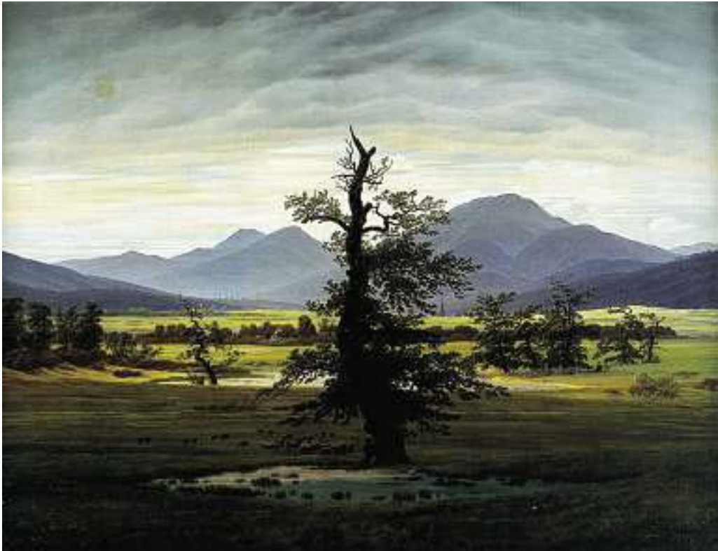
Caspar David Friedrichs Gemälde Der einsame Baum (1822). Die Eiche (hier als Sinnbild für Isolation und Einsamkeit) ist bis heute ein wiederkehrendes Motiv in der deutschen Kunst, das unterschiedliche symbolische Bedeutungen besitzt.

Eichenblättern bindet, und zum anderen durch die Namen der drei Männer, die in die Rinde von drei dicken Baumstämmen geritzt sind. Die Seelen der Patrioten gehen quasi in den Wald über. Der deutsche Wald erscheint von den Napoleonischen Kriegen bis heute als heimische, wenngleich unheimliche Kraft für die Deutschen, dagegen aber als Falle für unachtsame Feinde. Friedrichs Chasseur im Wald (um 1814) verweist direkt auf die Grande Armée. Sie wird hier als einsame Gestalt im Schnee dargestellt, die sich den Tiefen des deutschen Waldes gegenüber sieht. Die hinter der Gestalt auf einem Baumstamm sitzende Krähe lässt die bevorstehende Bedrängnis erahnen. 8 Das um die gleiche Zeit entstandene Felsental (Grab des Arminius) lässt sich ebenso als patriotische Äußerung interpretieren. 9 So wie nur wenige Jahre zuvor Heinrich von Kleist in Die Hermannsschlacht (1808–09) Ar-