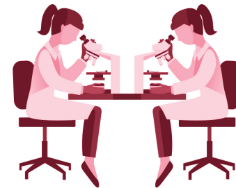
Personal für Forschung und Entwicklung in der Wirtschaft (in 1.000)

1996 11,7 Ost | West 88,3 2006 11,9 Ost | West 88,1 2017 10,9 Ost | West 89,1