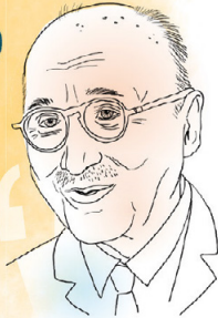
Jean Monnet (1888–1979), einer der 11 „Gründerväter Europas“

Nichts ist möglich ohne die Menschen, nichts ist von Dauer ohne die Institutionen.