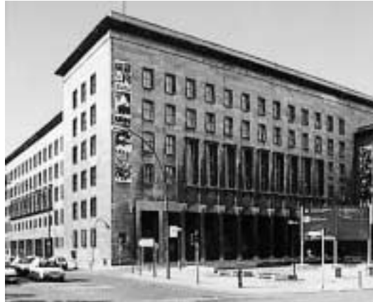
Abb. 2: Bundesministerium der Finanzen